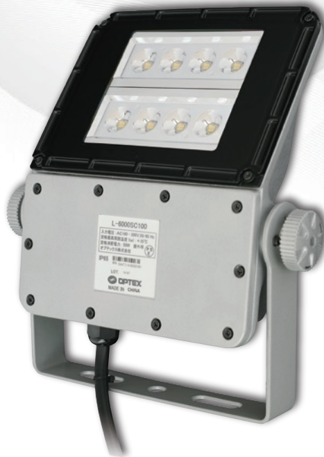
中規模(10~15車室)向けLED照明 L-6000SC100