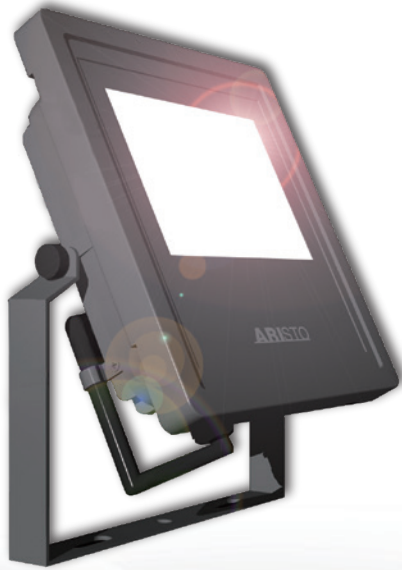
小規模(5~10車室)向けLED照明 FB25J-50H-A