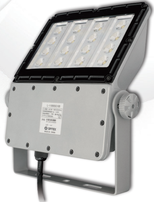
大規模(15~20車室)向けLED照明 L-11000SC100