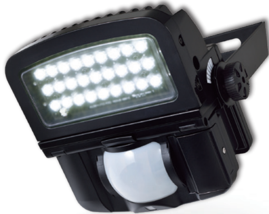
小規模(5~10車室)向け センサー体型LED照明(調光タイプ) LC-3300SC90D PRO